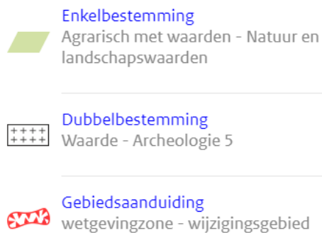
Figuur 1.2 Uitsnede uit vigerend bestemmingsplan Buitengebied Noord. Getoonde legenda behoort tot de plekinformatie van het met een plaatsicoon aangewezen punt. (Bron: Ruimtelijkeplannen.nl).

Binnen het geldend bestemmingsplan wordt de bestemming 'Agrarisch met waarden - Natuur en landschapswaarden' omgezet naar de bestemming Natuur middels de wijzigingsbevoegdheid. De dubbelbestemmingen waarde archeologie blijven van kracht.