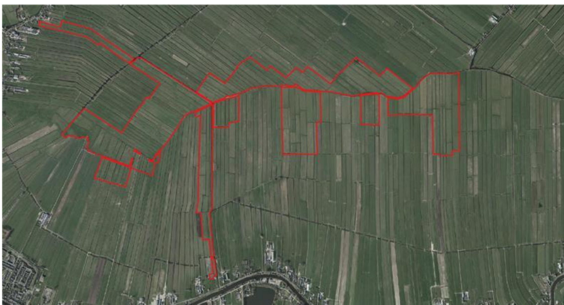
Figuur 1.1 Globale ligging plangebied en omgeving

Het plangebied van voorliggend wijzigingsplan is gelegen in de gemeente Bodegraven-Reeuwijk. Het plangebied van voorliggend wijzigingsplan is globaal gelegen tussen het veenriviertje de Meije (ten zuiden van de Nieuwkoopse Plassen) en de Oude Rijn. In figuur 1.1 is de begrenzing van het wijzigingsplan opgenomen.