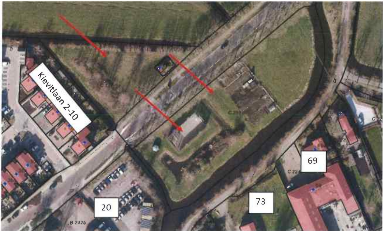
Afbeelding: mogelijke vestigingslocaties brandweer (i.v.m. opkomsttijden)