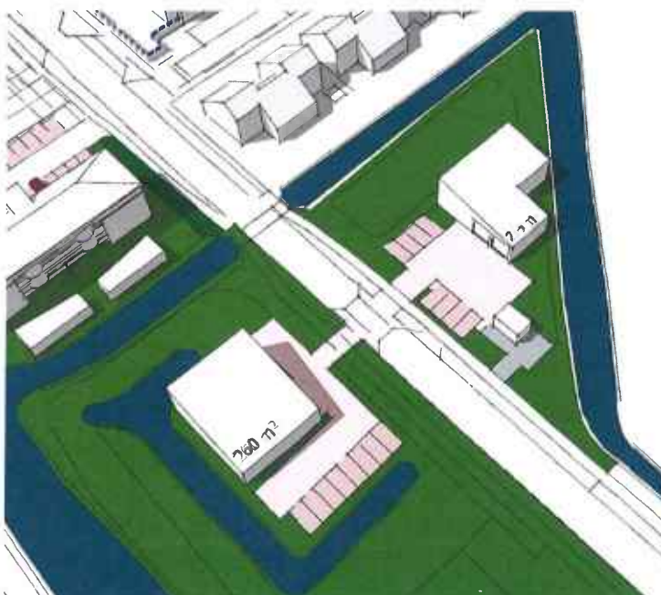
Afbeelding: Ruimtelijke inpassing van de "Bodegraafse brandweergarage" aan De Groendijck.

Om een gevoel te krijgen bij de mogelijke inpassing van een nieuwe brandweergarage hebben we de massa zoals die (ongeveer) wordt gerealiseerd achter het Shellstation in Bodegraven, in de hierboven weergegeven locaties geplaatst (NB: het ruimtebeslag zal beperkter zijn dan in Bodegraven). Dat levert het volgende beeld op.