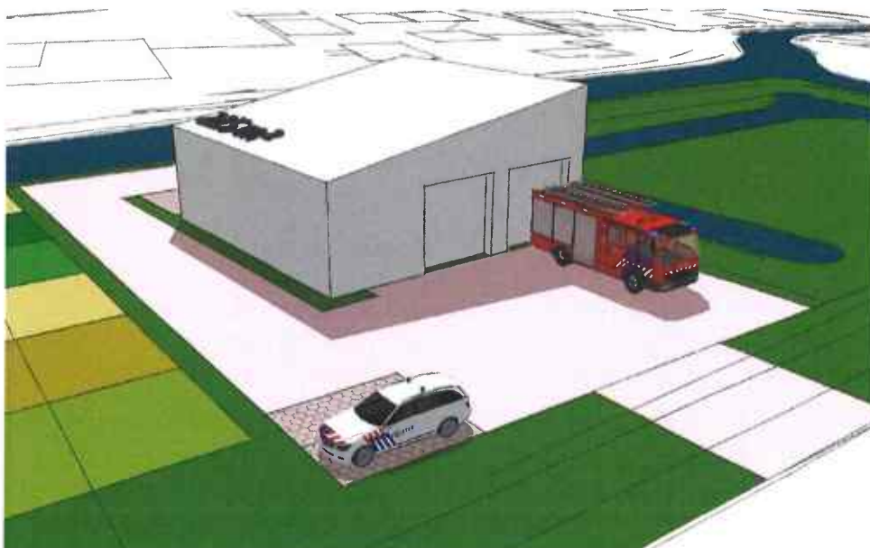
Afbeelding: massastudie van brandweergarage naast voetbalkooi