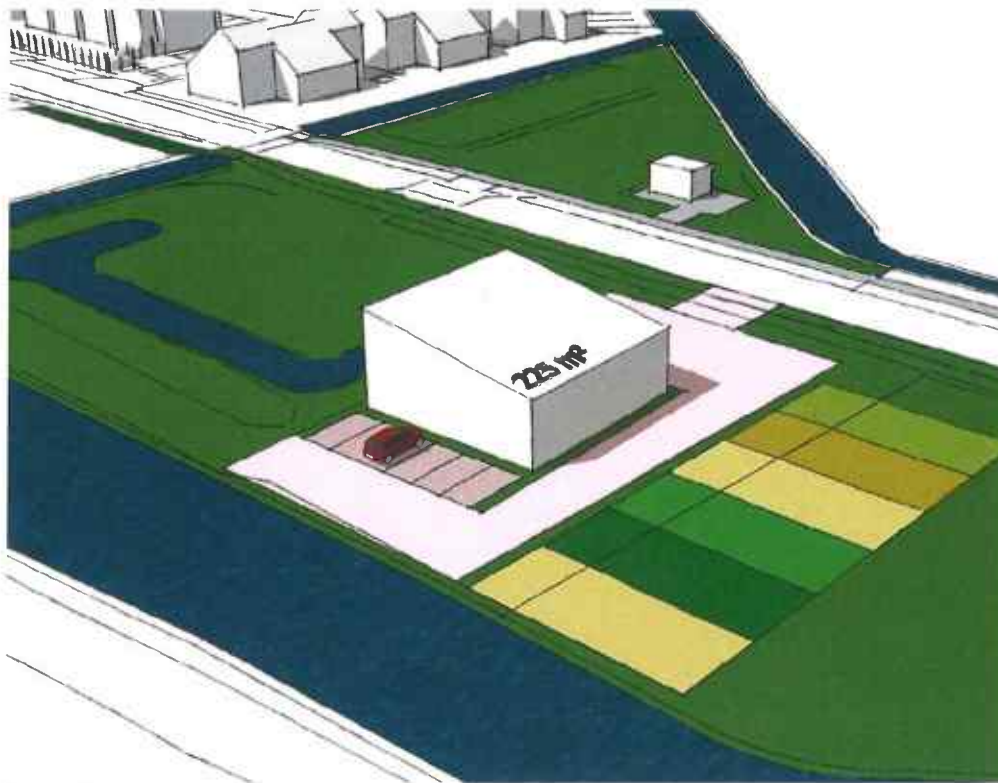
Afbeelding: massastudie van brandweergarage naast voetbalkooi

De drie bovenstaande afbeeldingen laten zien, dat inpassing van een brandweergarage met bijbehorende buitenruimte, ruimtelijk aanvaardbaar is (te maken).