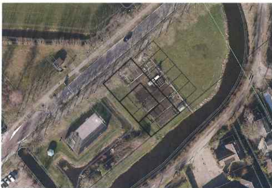
Afbeelding: mogelijke invulling kavel voor brandweergarage naast voetbalkooi

Daarom hebben we ook globaal beoordeeld wat de impact op het ruimtegebruik zal zijn indien de brandweergarage wordt gerealiseerd naast de bestaande voetbalkooi, gedeeltelijk op de gronden die nu gebruikt worden als volkstuinten. De volkstuinten moeten dan worden opgeschoven richting het naastgelegen grasveld. Hierdoor wordt de ruimte voor vakantiespelen enigszins ingeperkt. Indien dit niet bespreekbaar is voor de gebruikers van dit terrein (vakantiespelen), dan kan ook worden overwogen om de volkstuinten te verplaatsen naar de overzijde van De Groendijck (achter de woningen aan de Kievitlaan).