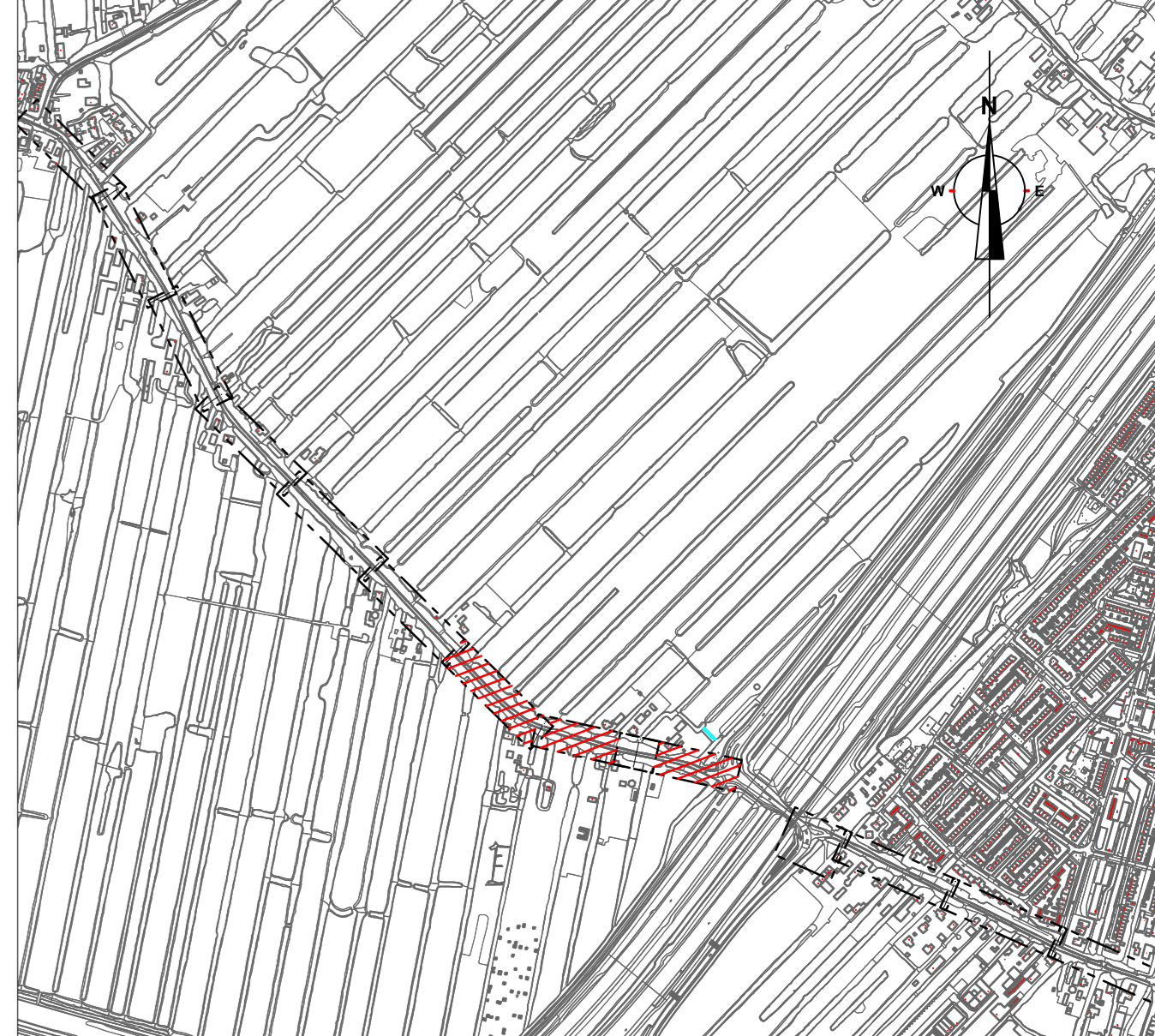
Omschrijving Schaal n.v.t.