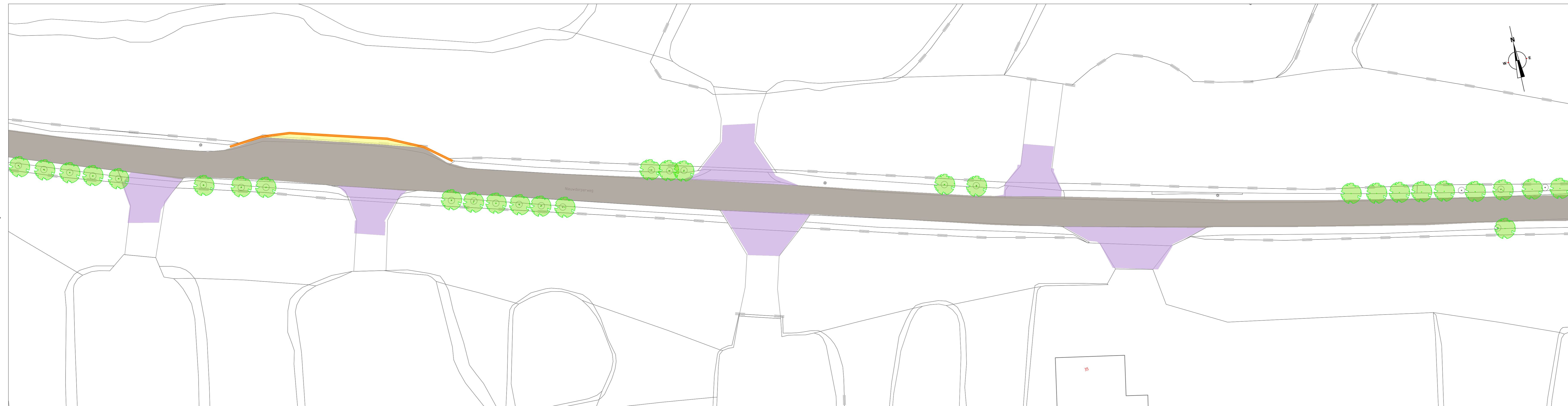
Bovenaanzicht blad 3 deel 2 Schaal 1:200