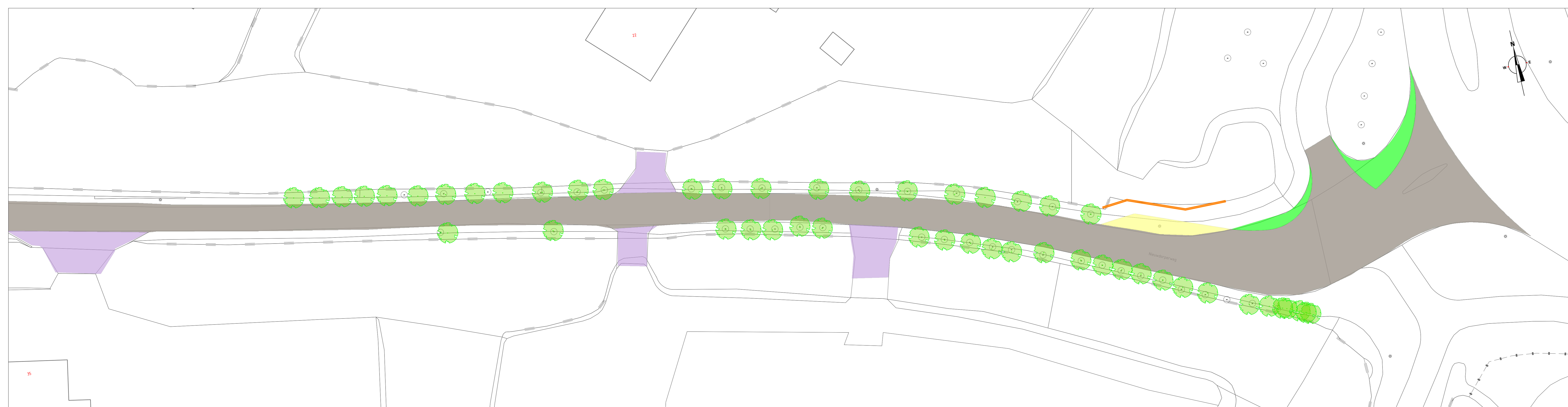
Bovenaanzicht blad 3 deel 3 Schaal 1:200