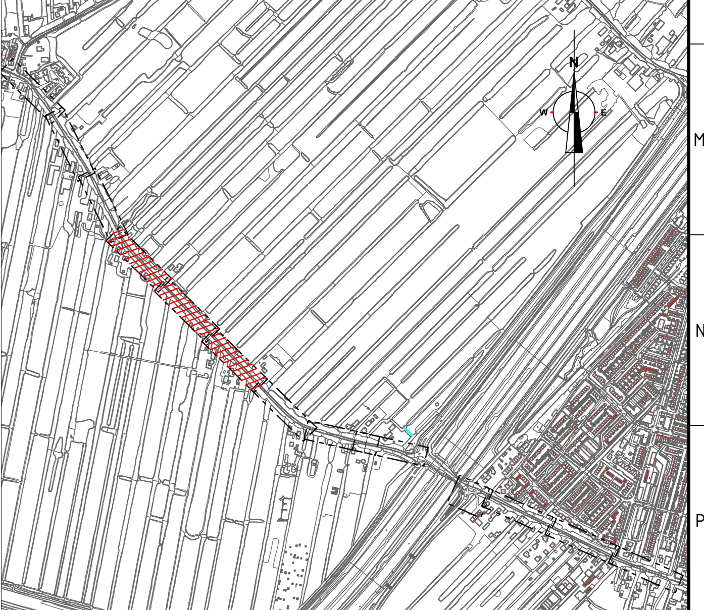
Omschrijving Schaal n.v.t.